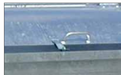
Lip voor hangslot (optie).