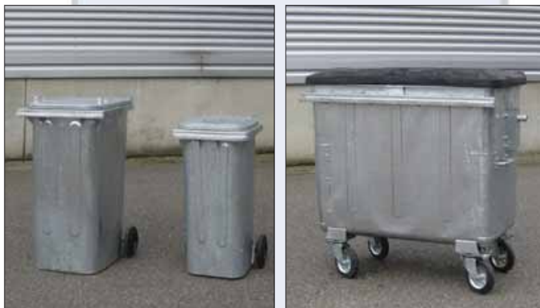
stalen containers MGBS 120, MGBS 240 et MGBS 660

Er zijn diverse afsluitmogelijkheden beschikbaar, zoals driekantsloten, zwaartekrachtsloten en kinderveilige sloten.