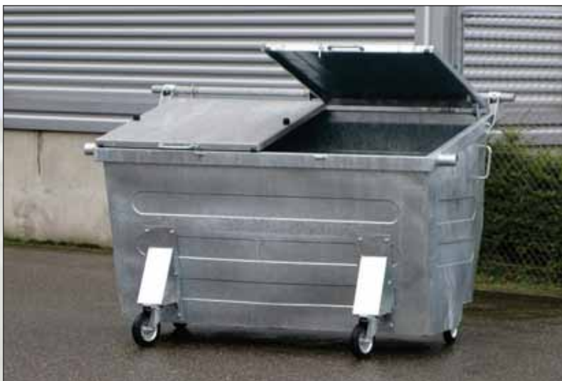
2500 liter container met stalen deksel.

Grote volumes, geschikt voor DIN opnames. Ook deze containers zijn thermisch verzinkt. De deksels kunnen worden geleverd in staal of kunststof (gedeeld). De stalen deksels worden geleverd met dekselveren. De standaard uitvoering heeft twee vaste en twee zwenkwielen.