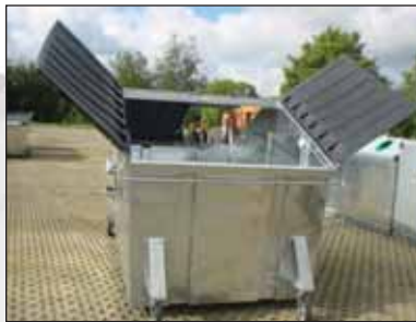
speciale uitvoering voor bv. storten vanaf een verhoging.