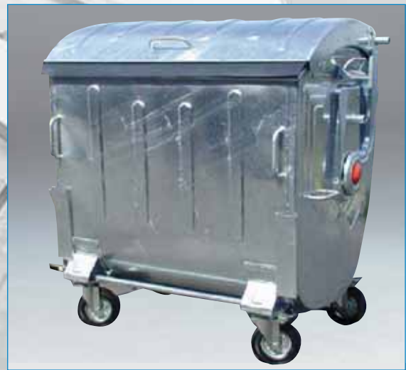
Klassieke industrie containers