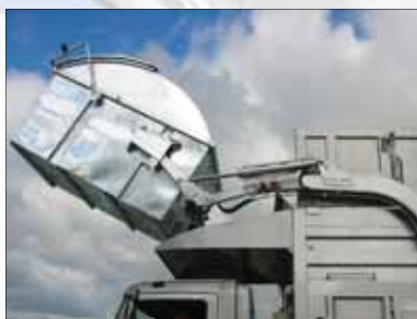
De deksel opent pas boven de bak van de wagen en is voortijdig verlies uitgesloten.

Voor middelgrote tot zeer grote volumes in combinatie met een ARBO-vriendelijke handling door de afvalinzamelaar zijn front loaders bijzonder geschikt. De front loaders worden met een speciale opname geleegd via de voorkant van de wagen. Hierbij kan de inzamelaar in de auto blijven zitten en het hele proces sturen en controleren.