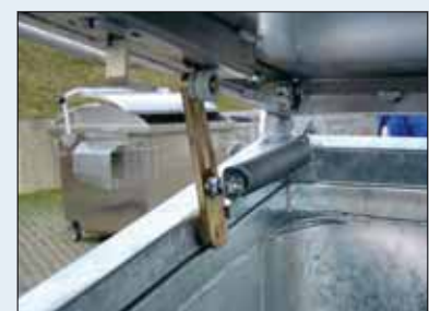
deksel blijft open staan door veermechanisme