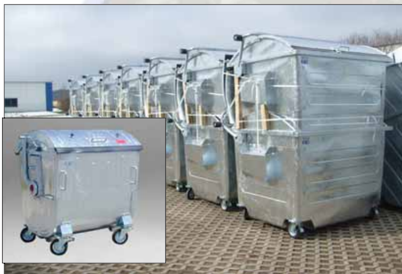
stalen containers met rond deksel zijn leverbaar tot een volume van 6500 liter.

Onze stalen containers zijn thermisch verzinkt en daardoor weerbestendig. Ze kunnen worden geleverd met alle standaard opnames, zoals DIN, kam en Geesink. De grote uitvoeringen (vanaf 2500 liter) worden geleverd met front- of rearloader opname. Stuk voor stuk zijn het zeer solide containers.