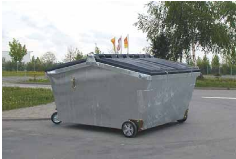
stalen 5000 liter container met aan beide kanten een kunststof deksel