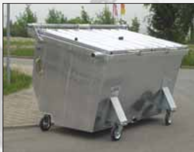
stalen 3000 liter container met geremde wielen en stalen deksel