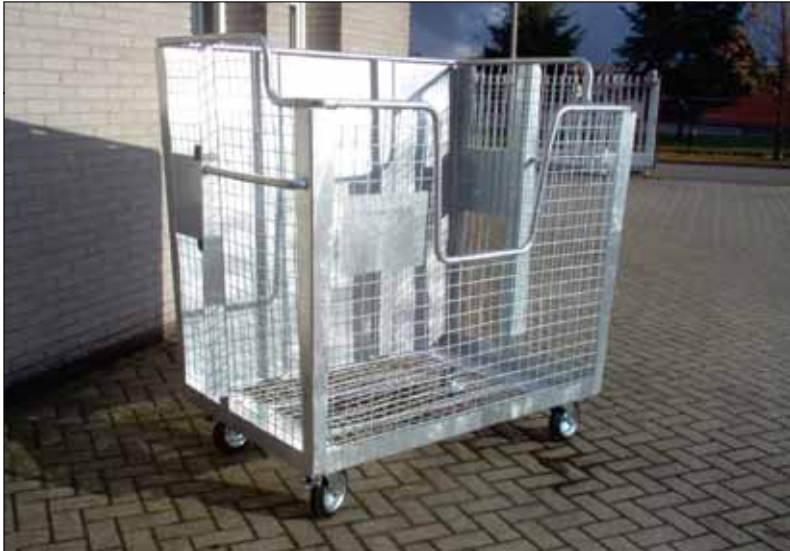
gaascontainer 2000 liter met Geesink opname

Gaascontainers helpen om uw voorraad visueel te houden. Gaascontainers voorkomen verstikking van kleding of verpakkingsmaterialen.