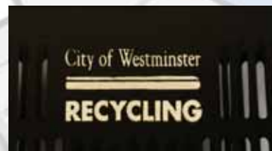
goudfolie opdruk (hier London City)