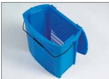
korf met dichte handgrepen, optioneel

Niet altijd is de oplossing een extra minicontainer. Waar de gebruiker klein behuïsd is, kan een recyclebak of korf een beter alternatief zijn. Alle uitvoeringen van onze inzamelbakken en -korven kunnen voorzien worden van deksels. De inhoud blijft zo droog en papier waait niet over straat.