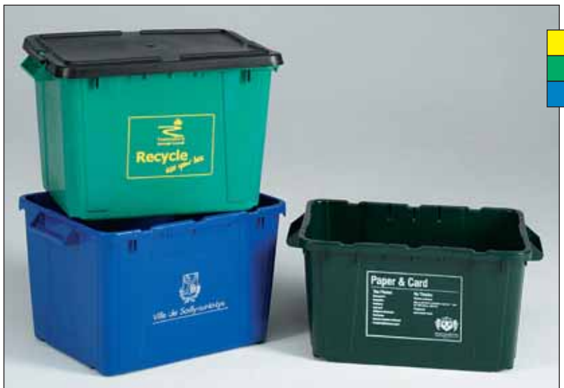
inzamelbakken voor buitengebruik (bijnaam: bembakken)

Niet altijd is de oplossing een extra minicontainer, of een inzamelkorf (bedoeld voor gebruik binnen, in schuur of garage). Waar de gebruiker klein behuist is, kan een recyclebak in de achtertuin buiten blijven staan, en op inzameldagen naar de straat gedragen worden. Want wie rijdt er nu graag een afvalcontainer door zijn huis! Recyclebakken kennen miljoenen tevreden gebruikers in de V.S., Groot Britannië, Frankrijk en België. De afmetingen zijn afgestemd op 2-wekelijks legen.