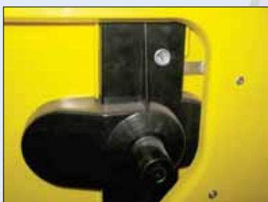
driekantslot op DIN adapter, alleen op MGB 1100.