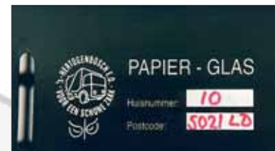
zeefdruk op voorzijde (hier Den Bosch)