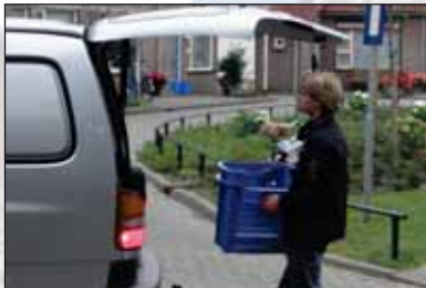
huis-aan-huis inzameling in Helmond via vereniging