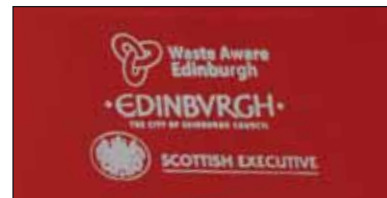
hot stamp bedrukking op voorzijde (hier Edinburgh)

Inzamelkorven en -bakken kunnen op vele manieren worden gemarkeerd.