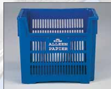
"onze klassieke korf", meer dan 1.000.000 in gebruik. Nu niet meer leverbaar, de mal is versleten.