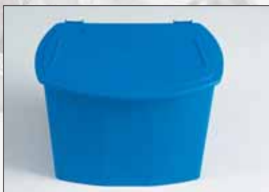
art.nr.: PS-325-D scharnierdeksel