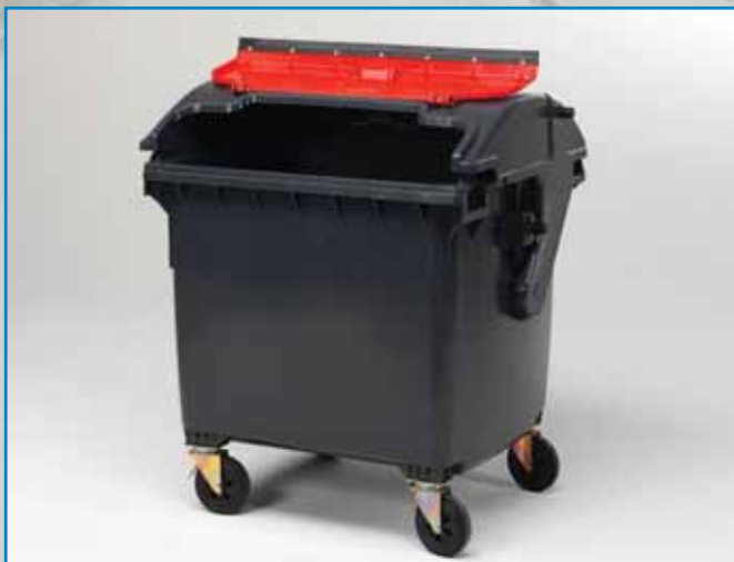
Vier-wielcontainers vele accessoires beschikbaar