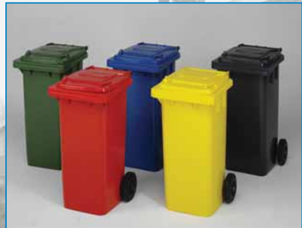
Twee-wielcontainers in vele kleuren en maten uit voorraad