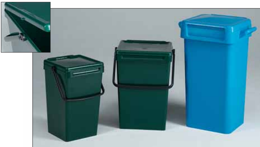
dankzij ingenieuze constructie blijft ook een omgevallen bak dicht

Waar geen plaats is voor een minicontainer, zijn onze inzamelbakken uitstekend inzetbaar. Bak, kunststof hengel en (scharnier)deksel zijn zwaar uitgevoerd en behoorlijk vandaalbestendig.