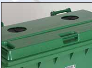
glasrozetten, mogelijk in alle deksels