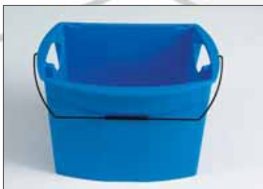
art.nr.: PS-325-100 stalen hengsel met kunststof handvat