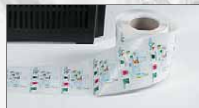
maatwerk stickers (hier Pornic, Frankrijk)