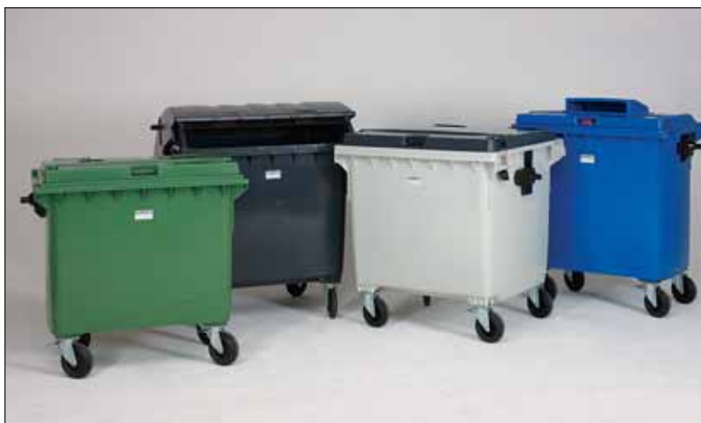
veel mogelijkheden, veel voorraad

Iedere container bestaat uit een HDPE (polyethyleen) romp en deksel. Het deksel heeft 3 handgrepen om het openen eenvoudiger te maken. Iedere container wordt standaard geleverd met 4 zwenkwielen met vol rubber banden \varnothing 200 mm (zwart), 2 stuks zijn voorzien van een voetrem. In de bodem van de romp is een uitloopstop voorzien. Iedere container voldoet aan de EN 840 norm.