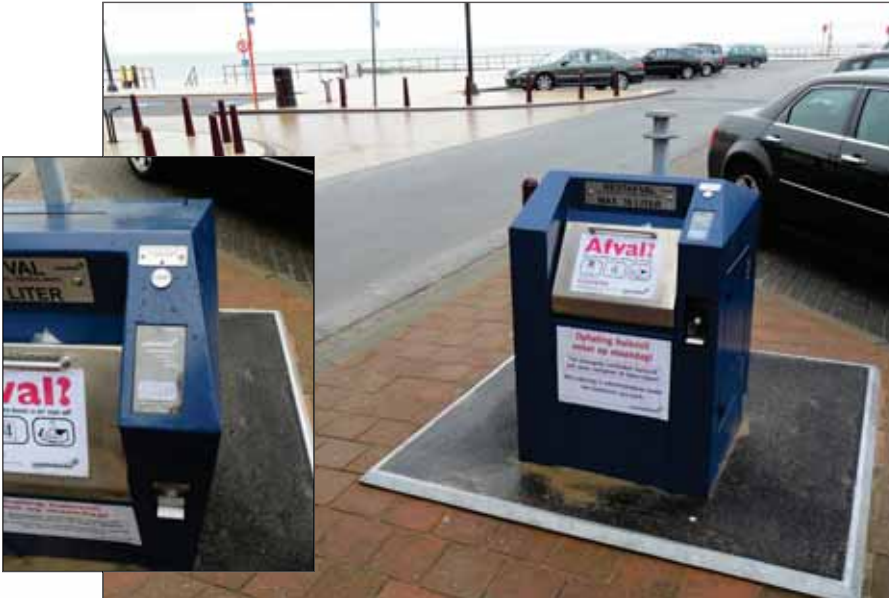
Toegangscontrole met muntautomaat op een ondergrondse container (Gemeente Middelkerke, BE)