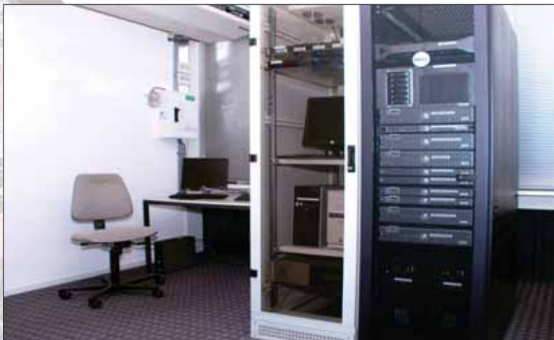
Een eigen serverpark met externe back-up ontvangt en bewaart uw gegevens of geeft deze door aan uw dienstverlener.

ENGELS heeft een zeer moderne toegangscontrole voor ondergrondse afvalvoorzieningen in het programma opgenomen.