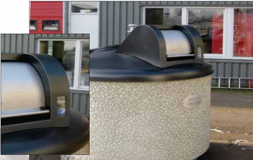
Toegangscontrole op een semi ondergrondse afvalcontainer