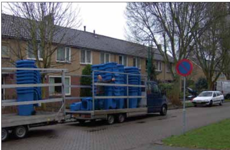
uitzetwerkzaamheden in de gemeente Bunnik

Nadat alle werkzaamheden zijn uitgevoerd beschikt Engels HLC over een digitaal container registratiebestand. In dit bestand is iedere uitstaande container (voorzien van chip en/of adres etiket) gekoppeld aan een adres. Dit bestand dragen we over aan de opdrachtgever, of importeren we in ons containerbeheersysteem.